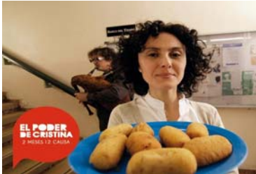
Imagen promocional El Poder de Cristina

En esta revista número seis vamos a hablar sobre la grabación, la emisión y la repercusión del anuncio sobre Bancos de Tiempo para la campaña "El poder de la gente", de la cadena de televisión nacional Tele 5, para la que contamos con nuestro Banco del Tiempo.